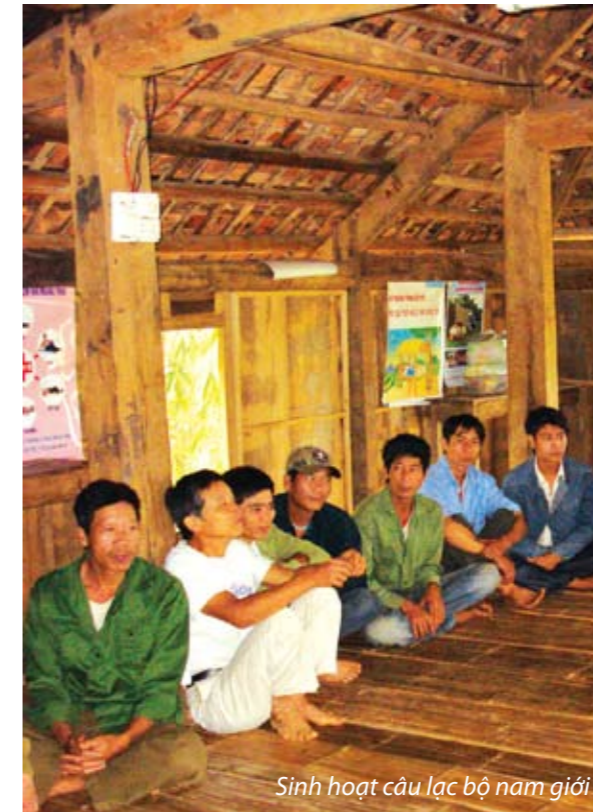
Sinh hoạt câu lạc bộ nam giới

Hiện nay, tại Việt Nam đang có khá nhiều tổ chức thực hiện sứ mệnh phòng chống bạo lực gia đình và đối tượng hưởng lợi được hưởng tới thường là phụ nữ bị bạo lực hoặc cán bộ trực tiếp làm việc với người bị bạo lực. Tuy nhiên, xét trên một góc độ nào đó, những chương trình nghiên cứu và can thiệp này sẽ khó có thể toàn diện và hiệu quả nếu không có những can thiệp đối với nam giới.