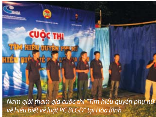
Nam giới tham gia cuộc thi “Tìm hiểu quyền phụ nữ về hiểu biết về luật PC BLGD” tại Hòa Bình

Cách truyền thông chiến lược có nghĩa là thiết kế các hoạt động và sản phẩm đặc trưng để đưa đến khán giả. Phần đông mọi người Việt nam không mấy hiểu biết về các chủ đề như “Giới” hay “Bạo lực Gia đình”, đặc biệt hơn là đối tượng mục tiêu của chúng ta không tìm cách để có thêm kiến thức về các chủ đề này. Do vậy, Chiến dịch Truyền thông (JCC) tập trung triển khai các sáng kiến, tìm ra ảnh hưởng tác động quy mô lớn ban đầu rồi tập trung vào việc chuyển tải tới người dân những thông điệp ngắn, mạnh mẽ theo thực tế cuộc sống hàng ngày của họ thông qua một số hình thức như phát quảng cáo dung lượng 30 giây trong chương trình truyền hình họ ưa thích hay trong các trận bóng đá nổi tiếng. Bằng cách