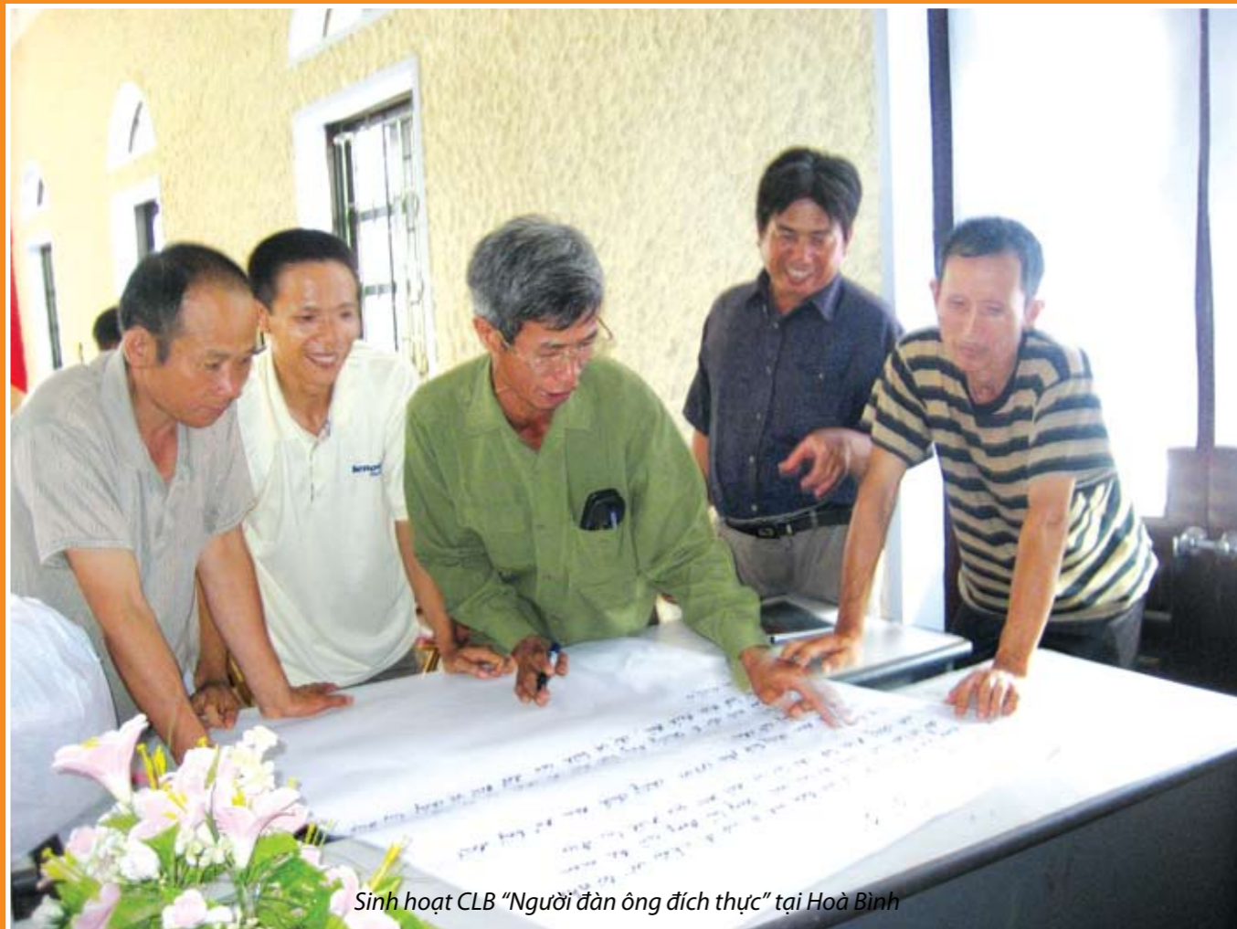
Sinh hoạt CLB “Người đàn ông đích thực” tại Hoà Bình

Nếu soi vào nhân vật Hoàng để nhìn mình thì không riêng gì tôi đâu, rất nhiều đàn ông trong gia đình trí thức phải giật mình và cần xem lại mình. Có thể ít, có thể nhiều, bởi trong gia đình truyền thống của người Việt vẫn còn quan niệm “nhà chỉ có một nóc, nước không thể hai vua”, đó chính là mầm mống của bạo lực gia đình mà người ta không nhận thấy. Phải thú thật, sau khi đóng xong bộ phim này, tôi cũng phải cảnh giác với chính bản thân. Những sự ngọt ngào có khi cũng là bạo lực nếu mình quá hiểu thẳng trong cuộc sống.