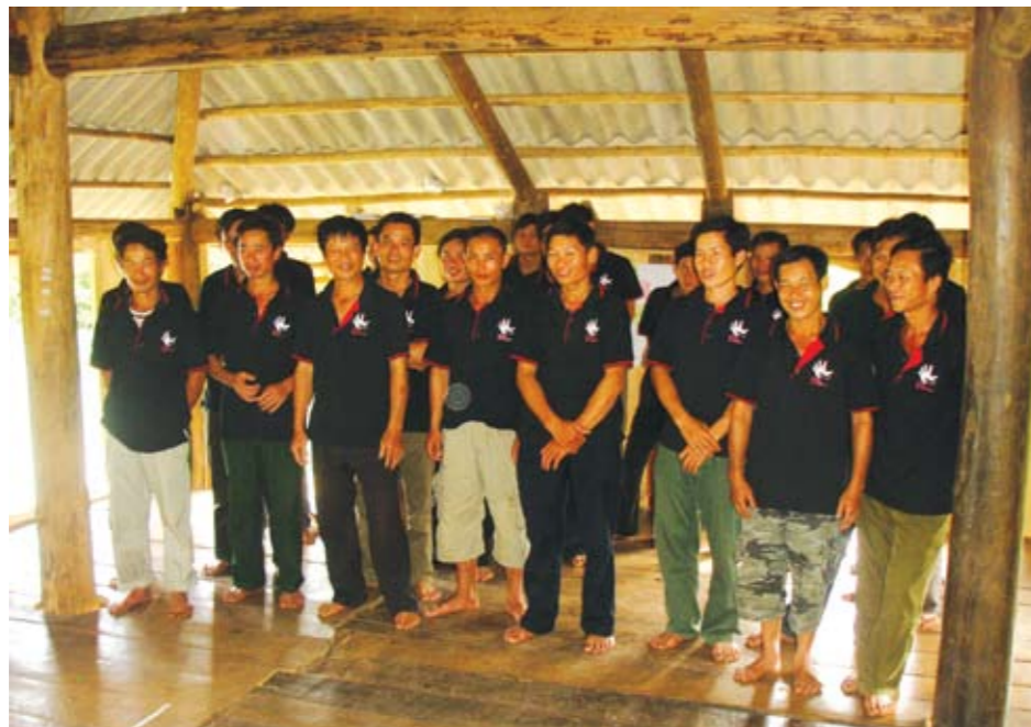
Tăng cường sự tham gia của nam giới vào các hoạt động phòng chống bạo lực gia đình

Trong nhà người đàn ông đóng vai trò tối cao khi cần quyết định, tham gia hay thụ hưởng. Trách nhiệm của người đàn ông vì thế cũng trở nên hết sức nặng nề. Không chỉ vị thế của họ được đề cao một cách thái quá mà cũng giống như một số địa bàn miền núi khác, người đàn ông ở Hoà Bình đang phải chịu những áp lực về trách nhiệm, sự chu toàn trong vai trò trụ cột gia đình. Bên cạnh đó người phụ nữ các dân tộc ở đây lại quá quen với vai trò thụ động, phụ thuộc mà cả nếp tư duy truyền thống lẫn quan niệm hiện tại của cộng đồng còn đang trói buộc họ.