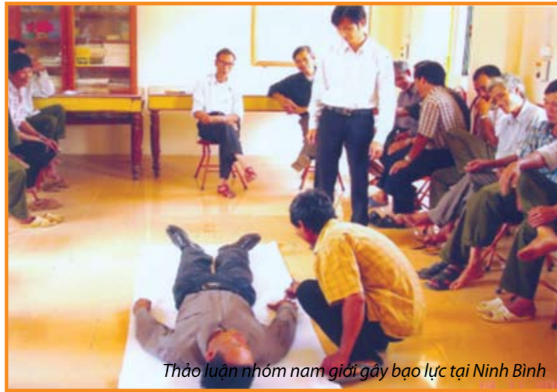
Thảo luận nhóm nam giới gây bạo lực tại Ninh Bình

hai vụ trúng, một vụ mất. Rau màu thì tươi hơn vì vợ chồng tôi trồng nhiều loại và lại cũng có nhiều đất để trồng .... Bây giờ nhà tôi uống rượu ít hơn, mỗi bữa chỉ làm một chén và không còn đánh chửi vợ con nữa rồi. Hai đứa con cũng lớn nên có thể phụ giúp chúng tôi nên cũng đỡ vất vả ... Bây giờ khi gặp vấn đề gì hay vợ chồng có mâu thuẫn thì chúng tôi cũng biết cách để kiểm chế. Khi một trong hai người tức giận thì sẽ đi sang nhà anh chị hàng xóm ngồi một lúc, mấy anh chị đó cũng tham dự vào các CLB nên cũng dễ tâm sự... Tôi thấy rằng các ông chồng cứ cậy mình có sức khỏe nhưng nếu không có phụ nữ chúng tôi thì các ông ấy còn vất vả hơn nhiều ấy chứ... (cười)”