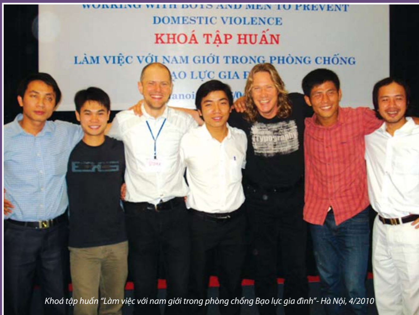
Khoá tập huấn "Làm việc với nam giới trong phòng chống Bạo lực gia đình" - Hà Nội, 4/2010