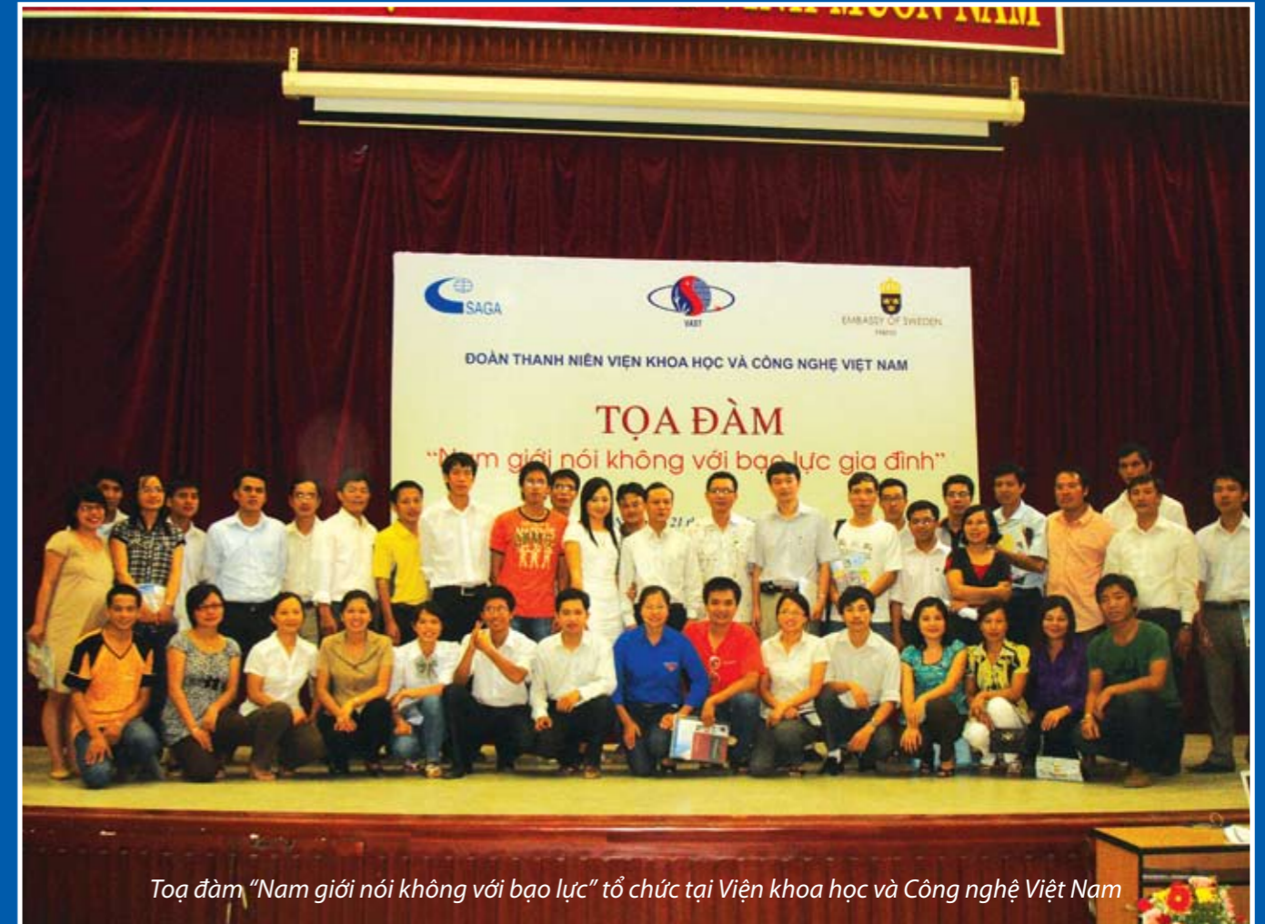
Toạ đàm “Nam giới nói không với bạo lực” tổ chức tại Viện khoa học và Công nghệ Việt Nam