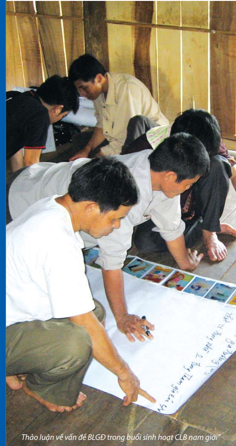
Thảo luận về vấn đề BLGD trong buổi sinh hoạt CLB nam giới

1. Xuất phát từ đặc điểm tâm lí của những nam giới trẻ: Họ (và cả những phụ nữ trẻ tuổi) có ít cơ hội để xác định các vấn đề bạo lực mà họ quan tâm đến và bày tỏ mong muốn giải quyết những vấn đề đó như thế nào. Những người trẻ tuổi vẫn được giảng dạy nhưng họ không lắng nghe. Để bắt đầu bất cứ công việc nào với nam giới trẻ hãy hỏi họ về cuộc sống và những câu chuyện của họ, thiết lập một diễn đàn để nói về các mối quan hệ, gia đình và các mối quan hệ thân tình của họ. Và điều rất quan trọng là hiểu được họ muốn thấy bạo lực được chấm dứt như thế nào..