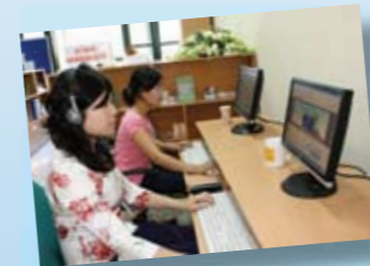
Tra cứu thông tin tại văn phòng CMRC