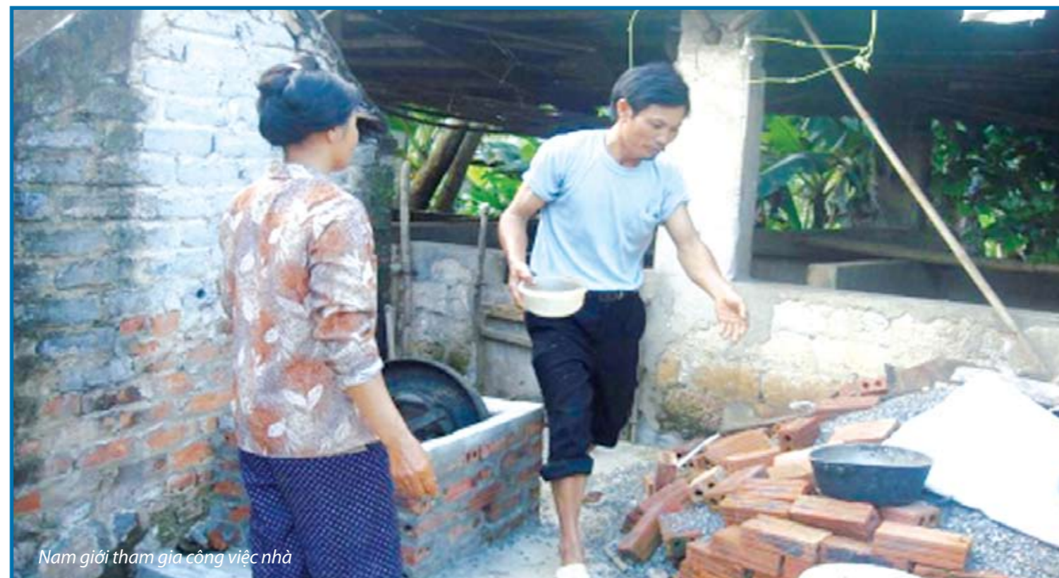
Nam giới tham gia công việc nhà

vấn đề khi vợ chồng anh có 5 đứa con và hai vợ chồng thực sự vất vả trong lao động kiếm sống và nuôi dạy cho các con ăn học. Những lúc khó