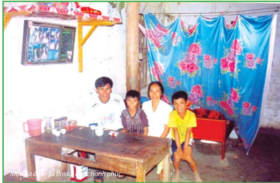
Một gia đình đã tìm lại được hạnh phúc