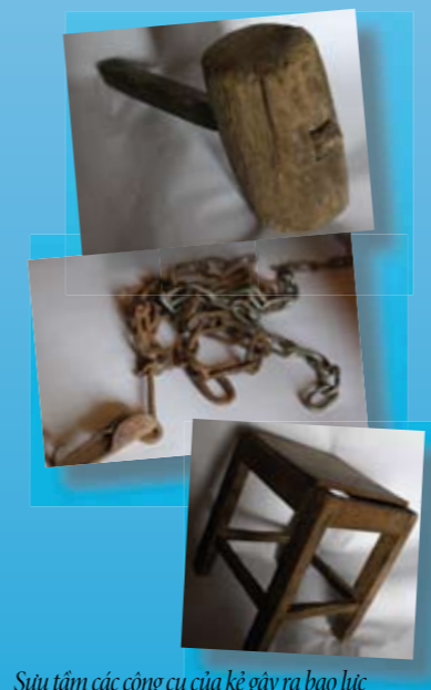
Sưu tầm các công cụ của kẻ gây ra bạo lực