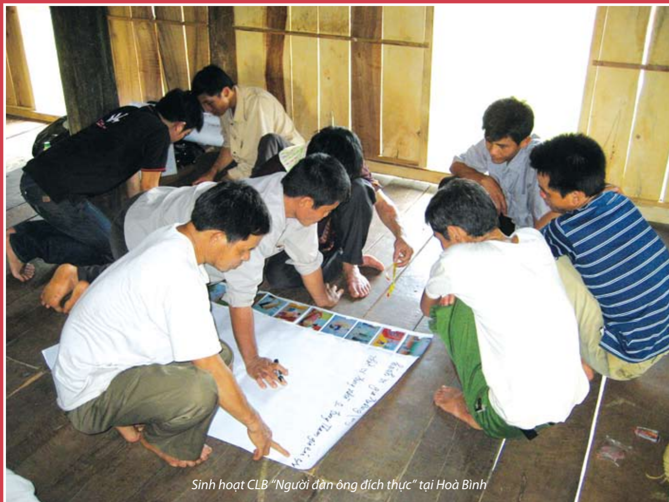
Sinh hoạt CLB “Người đàn ông đích thực” tại Hoà Bình