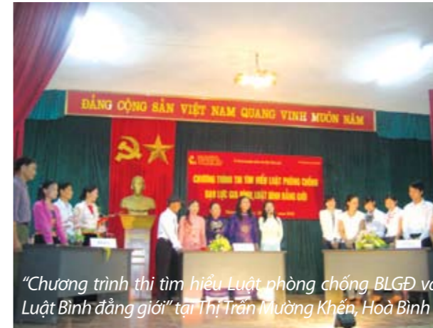
"Chương trình thi tìm hiểu Luật phòng chống BLGD và Luật Bình đẳng giới" tại Thị trấn Mường Khến, Hoà Bình

Nội dung tập huấn tập trung vào việc cung cấp kiến thức về bình đẳng giới, BLGD và các quyền của phụ nữ; Luật phòng chống bạo lực gia đình và những văn bản pháp luật có liên quan; kỹ năng làm việc với những người bị bạo lực và người gây bạo lực... Bên cạnh những kiến thức chung, với mỗi đối tượng khác nhau nên triển khai các khóa tập huấn khác với những mục đích khác nhau nhằm đảm bảo hiệu quả thực tế