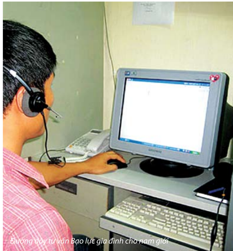
Đường dây tư vấn Bạo lực gia đình cho nam giới

Làm thế nào để các "thủ phạm" nam muốn gọi đến đường dây để được chia sẻ và tư vấn, trong khi họ ở thế chủ động gây ra bạo lực (để bị người khác chê trách, lên án) chứ không phải ở thế của nạn nhân, có thể tìm được sự cảm thông, bênh vực? Điều đó thực sự còn trông chờ vào chiến dịch truyền thông sắp tới cũng do CSAGA khởi xướng. Nhóm những người làm tư vấn cho đường dây mong muốn chia sẻ và tư vấn được càng nhiều càng tốt, song chúng tôi cũng không ngây thơ tin rằng 100% những nam giới có vấn đề về bạo lực gia đình sẽ tìm đến đường dây qua chiếc điện thoại. Những người