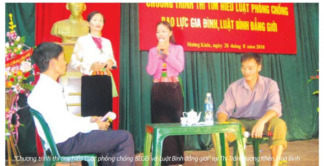
"Chương trình thi tìm hiểu Luật phòng chống BLGD và Luật Bình đẳng giới" tại Thị Trấn Mường Khến, Hoà Bình

Theo một số tài liệu nghiên cứu trên thế giới, tác động vào nam giới là cách tiếp cận mới hết sức hiệu quả trong phòng chống BLGD. Hầu hết các đối tượng tham gia khảo sát đều ủng hộ cho việc thu hút nam giới tham gia tích cực vào các hoạt động phòng chống BLGD tại địa phương. Điều đó được thể hiện qua mô hình sinh hoạt các Câu lạc bộ dành riêng cho những người gây bạo lực và nam thiếu niên với tên gọi mang tính tích cực như: Câu lạc bộ nam nông dân, Câu lạc bộ Vì hạnh phúc gia đình, Câu lạc bộ liên gia... Cũng như những Câu lạc bộ dành cho nạn nhân của BLGD, các câu lạc bộ này cũng cần có phương pháp, nội dung sinh hoạt phù hợp, hấp dẫn và thiết thực với người dân địa phương..