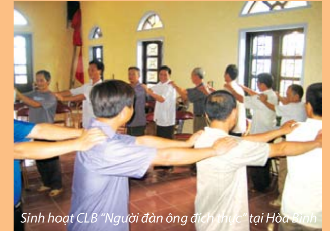
Sinh hoạt CLB “Người đàn ông đích thực” tại Hòa Bình