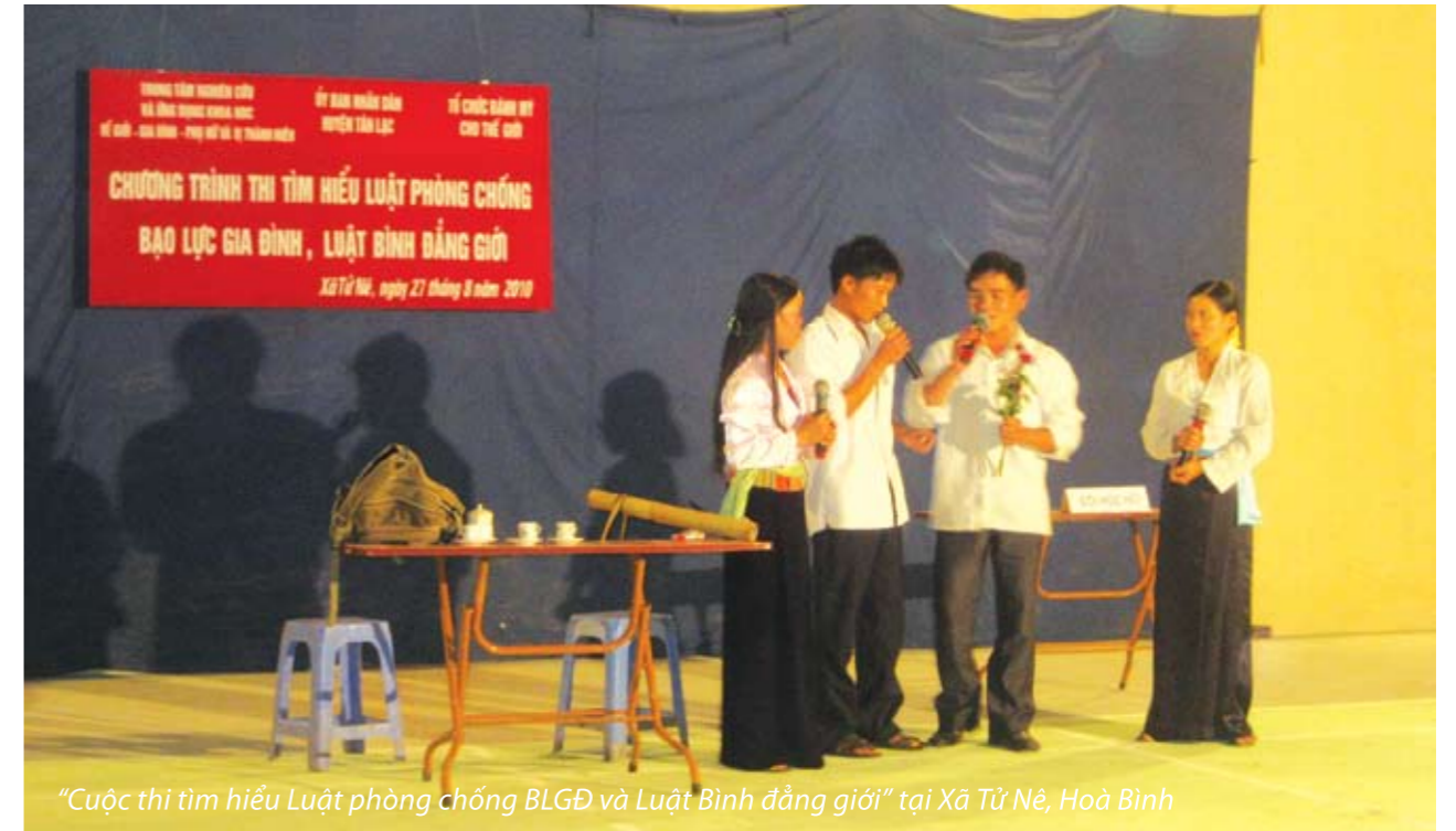
"Cuộc thi tìm hiểu Luật phòng chống BLGD và Luật Bình đẳng giới" tại Xã Tử Nê, Hoà Bình