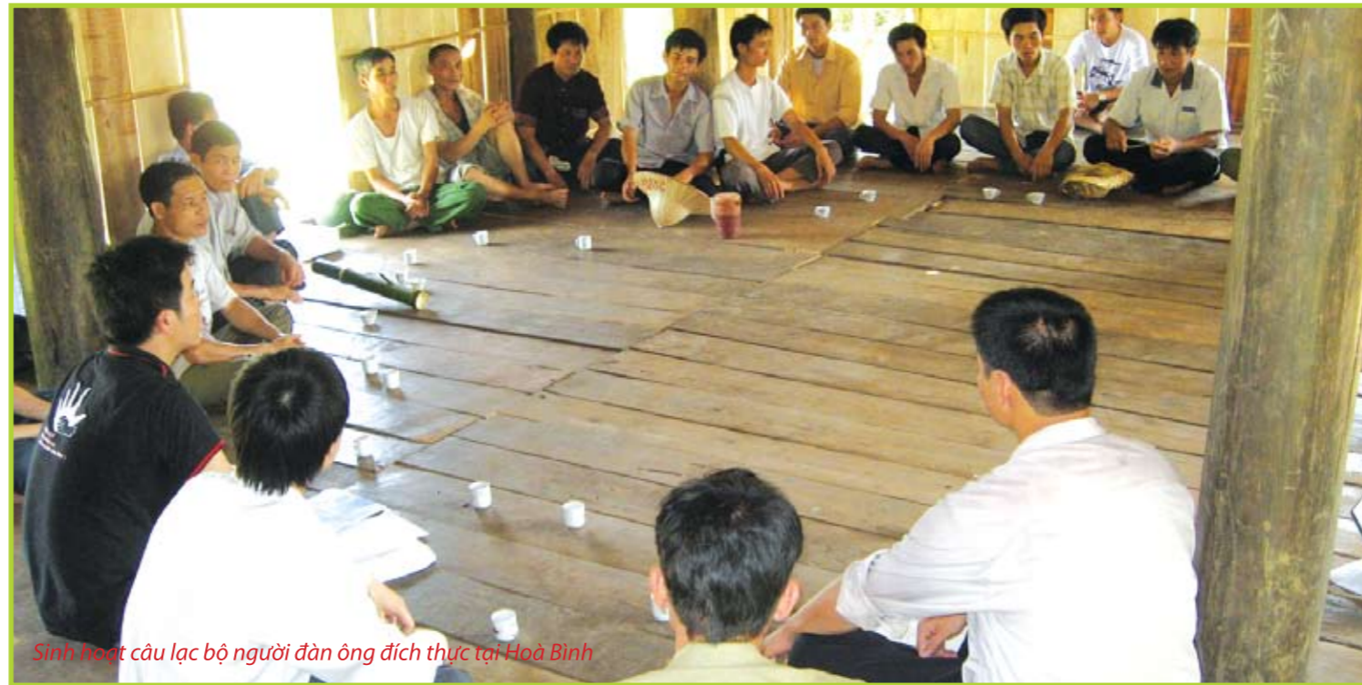
Sinh hoạt câu lạc bộ người đàn ông đích thực tại Hoà Bình

Điều này là đặc biệt như vậy bởi vì những sự kỳ vọng về nam tính tự nó không thể thỏa mãn hoặc không đạt được mục đích. Đây cũng có thể