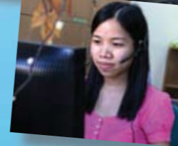
Tư vấn giải quyết các trường hợp bạo lực giới qua hotline