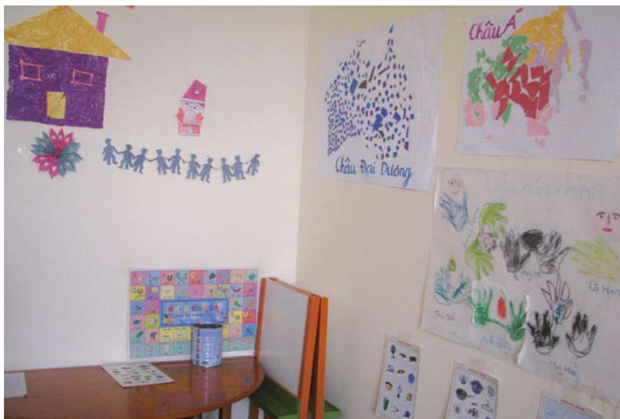
Góc học tập - Ngôi nhà bình yên