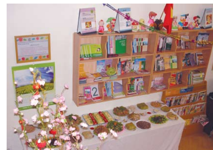
Một góc thư viện - Ngôi nhà bình yên

Đã hơn một năm kể từ khi bé H, 10 tuổi, quê ở Triệu Phong, Quảng Trị bị người bạn của ông ngoại XHTD, đến nay dư luận còn hết sức bức xúc vì vụ việc vẫn chưa được các ban ngành chức năng tại địa phương giải quyết một cách thỏa đáng. Bé H. đã được nhiều tổ chức xã hội từ Trung ương tới địa phương hỗ trợ để khắc phục những chấn thương tâm lý, bình ổn sức khỏe. Tuy nhiên, sự bình yên cho cuộc sống của bé và gia đình chỉ có thể đảm bảo khi công lí được sáng tác. Dưới đây là ghi nhận của Thông tin Bạo lực giới từ cuộc trao đổi giữa phóng viên với những cán bộ xã hội trực tiếp chăm sóc bé H tại Ngôi nhà bình yên.