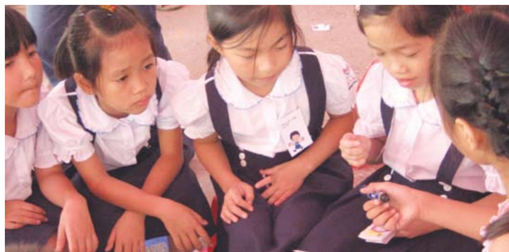
Trẻ em trường Bồ Đề và Tân Trào trong diễn đàn "Tiếng nói của trẻ em về phòng chống trùng phạt thân thể trẻ em"

Chương trình được thiết kế với hai mục tiêu chính: 1) Xây dựng kỹ năng bảo vệ trẻ em và phòng chống xâm hại trẻ em cho các tổ chức Chính phủ và phi Chính phủ; và 2) Xây dựng tài liệu hành vi bảo vệ và kế hoạch sử dụng lâu dài trong các cộng đồng ở Việt Nam.