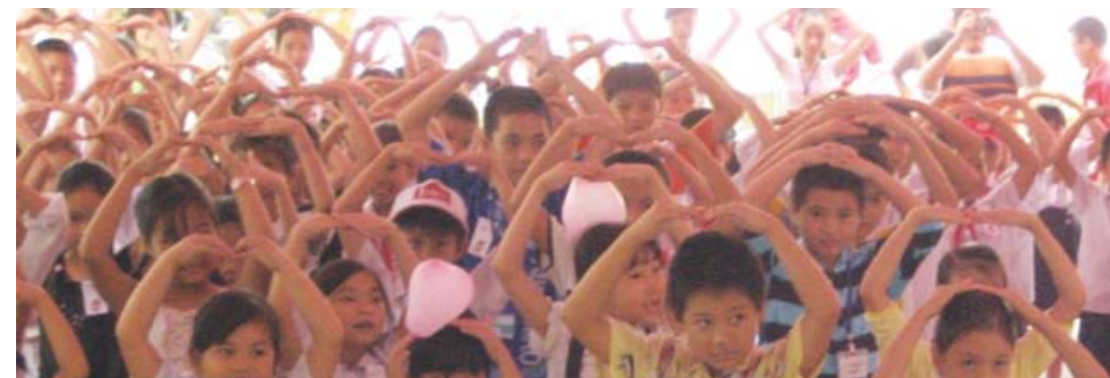
Trẻ em trường Bồ Đề và Tân Trào trong diễn đàn “Tiếng nói của trẻ em về phòng chống trùng phạt thân thể trẻ em” (Csaga, SCS)

Tại Malaysia, trước tình trạng nạn hiếp dâm ngày càng gia tăng, ngay từ cuối năm 2007, lực lượng cảnh sát Malaysia đã phải thành lập một đơn vị điều tra các loại tội phạm về xâm phạm tình dục trẻ em. Đơn vị mới này gồm 101 nhân viên nữ, được đào tạo quy củ để giải quyết các vụ việc liên quan đến xâm phạm tình dục trẻ em. Cảnh sát Malaysia hy vọng lực lượng này sẽ đẩy mạnh và nâng cao hiệu quả của cảnh sát trong việc xử lý các vụ việc liên quan đến xâm hại tình dục trẻ em và bạo lực trong gia đình.