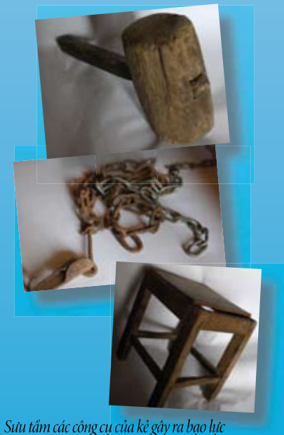
Sưu tầm các công cụ của kẻ gây ra bạo lực

04.3775.93.27 Hãy gọi để được tư vấn và cung cấp thông tin