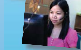
Tư vấn giải quyết các trường hợp bạo lực giới qua hotline