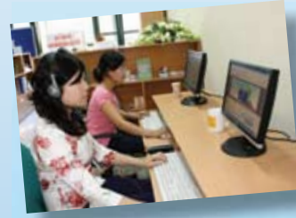
Tra cứu thông tin tại văn phòng CMRC