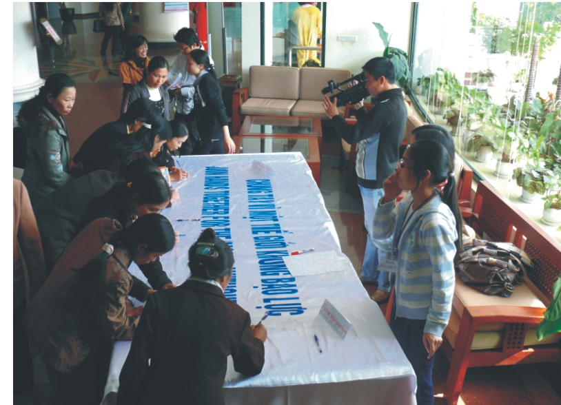
Các thành viên CLB cùng ký cam kết vì một thế giới không bạo lực nhân kỷ niệm ngày quốc tế xóa bỏ bạo lực với phụ nữ 25/11