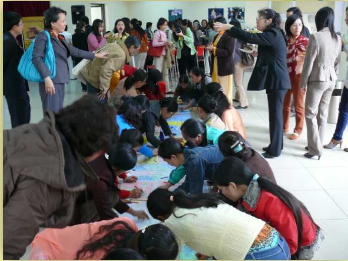
Vẽ tranh ước mơ về một thế giới không bạo lực