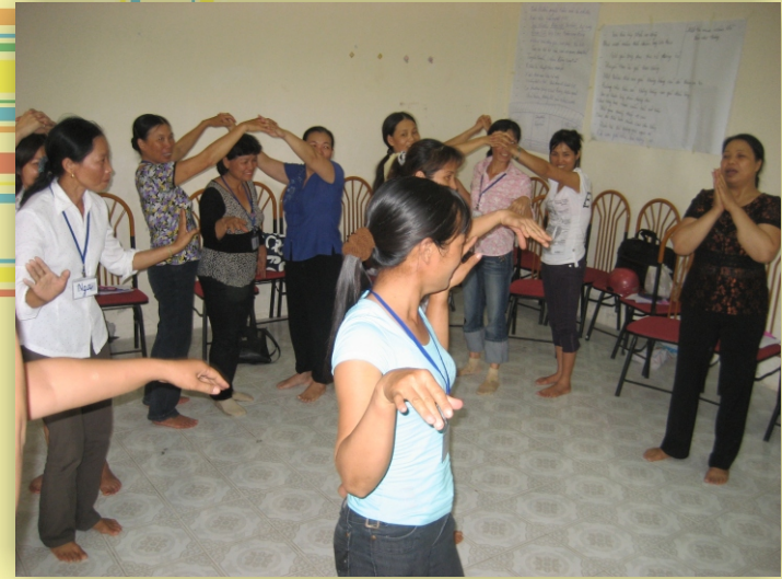
Vui chơi tại buổi sinh hoạt CLB