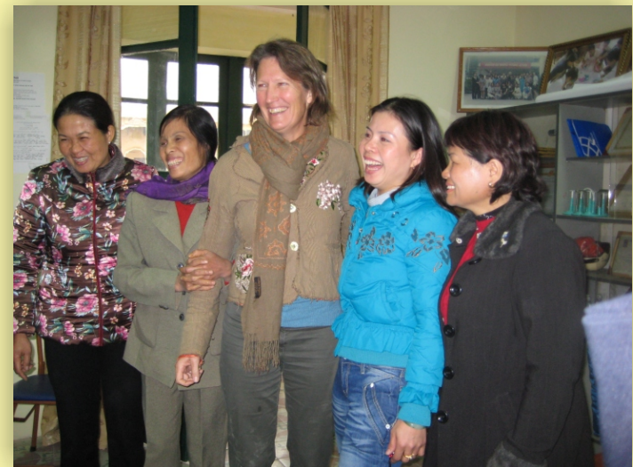
Giao lưu với khách quốc tế