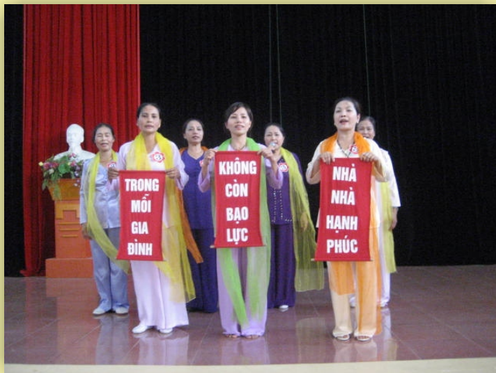
Hội thi tìm hiểu kiến thức về bạo lực gia đình tại CLB thị trấn Yên Viên - Gia Lâm - Hà Nội