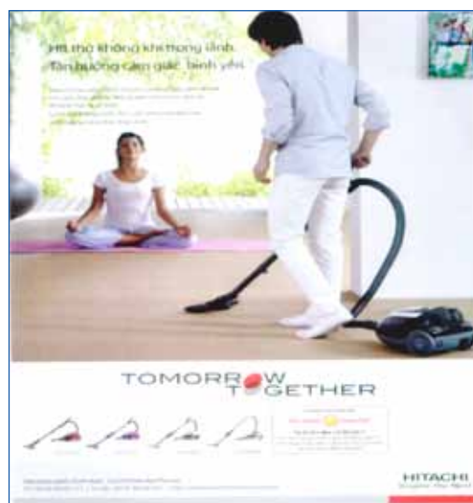
- Bức ảnh quảng cáo máy hút bụi: “ Hít thở không khí trong lành. Tận hưởng cảm giác bình yên ” ( Hạnh phúc gia đình 19/8/2011 )