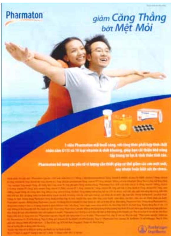
- Bức ảnh quảng cáo cho viên bổ Pharmaton: “Giảm căng thẳng, bớt mệt mỏi” ( Hạnh phúc gia đình 24/6/2011 )

Đây là những bức ảnh góp phần tạo điểm nhấn cho thông điệp về bình đẳng giới và có tác dụng chấp cánh cho hạnh phúc gia đình. Hình ảnh những người chồng, người cha rạng rỡ trong công việc nội trợ, chăm sóc con cái, vun đắp tổ ấm ... như những minh chứng khẳng định giá trị giới với những vai trò phi