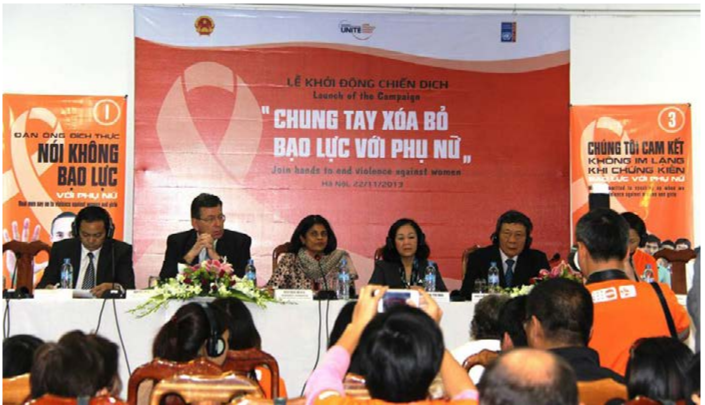
Hình ảnh Khởi động chiến dịch 16 ngày “Chung tay xóa bỏ bạo lực với phụ nữ” nhằm xóa bỏ bạo lực đối với phụ nữ do Liên Hợp quốc phát động

thứ tự ưu tiên hàng đầu của lực lượng an ninh quốc gia như một hoạt động thúc đẩy bình đẳng giới và sự tiến bộ của phụ nữ. Cùng với các đối tác, Quỹ An ninh trật tự Afghanistan (LOFTA) hỗ trợ Bộ nội vụ bằng cách trang bị những kỹ năng quản lý và lãnh đạo cho các nữ nhân viên an ninh tại Học viện cảnh sát Kabul. Hiện tại phụ nữ chỉ đại diện 1% trong toàn lực lượng an ninh ở đây. Một chương trình chuyên nghiệp ở Afghanistan đang tuyển chọn và đào tạo phụ nữ gia nhập lực lượng an ninh.