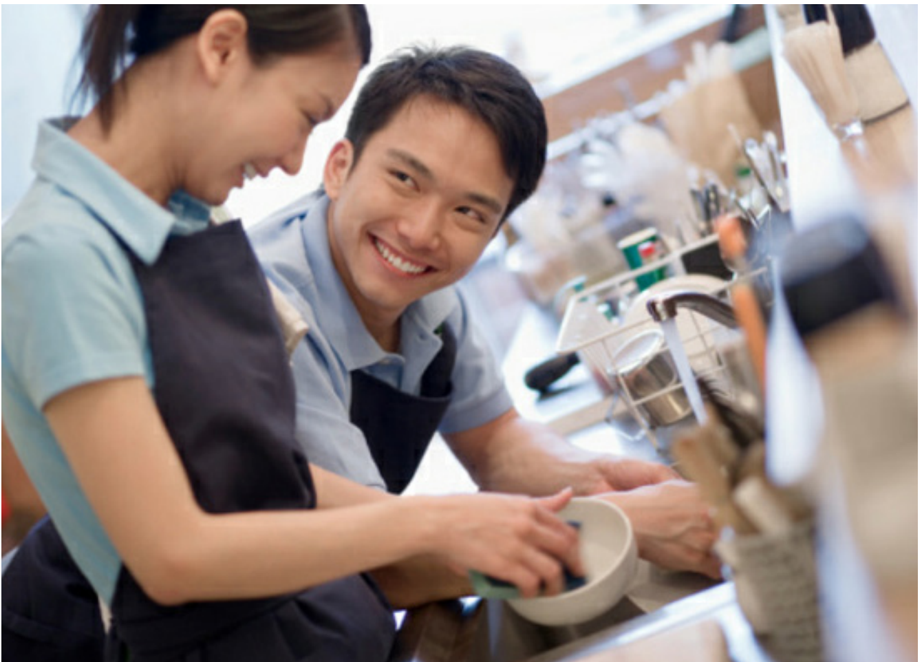
Hình ảnh bài Việc nhỏ mỗi ngày (P8): Giúp vợ làm việc nhà trên mục Tin tức xã hội , trang xahoi.com.vn , ra ngày 20/06/2012

(Trích Tại sao Bình Đẳng Giới tạo ra những bài viết hay và giá trị kinh doanh cho truyền thông - “Sứ mệnh khả thi”: Một công cụ vận động truyền thông và giới)