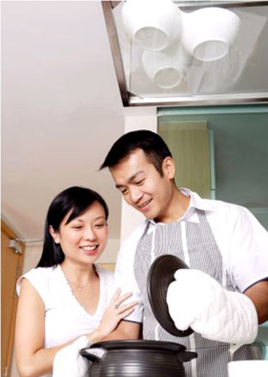
Hình ảnh bài Vợ tôi - cô ấy là người đẹp nhất trên mục Tình yêu - Hôn nhân , trang afamily.vn , ra ngày 18/10/2008

show “ Mỗi tuần một chuyện - Đối thoại với Lê Hoàng ” rằng để thay đổi tình trạng này cần phải có sự tham gia của cả đàn ông, phụ nữ?