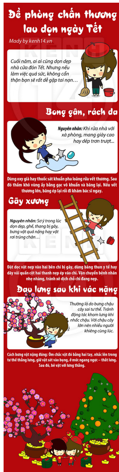
Hình ảnh bài Nguy hiểm dễ đến khi dọn nhà cửa đón Tết trên mục Kiến thức giới tính , trang kenh14.vn , ra ngày 5/1/2013